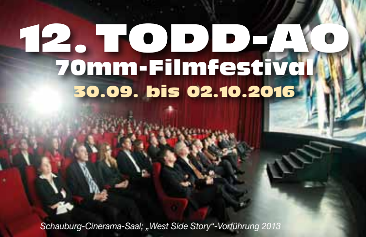
Schauburg-Cinerama-Saal; „West Side Story“-Vorführung 2013